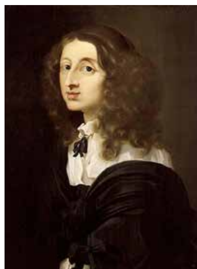
Drottning Kristina målad av Sébastien Bourdon.

Drottning Kristina (1626–1689) porträtteras redan i sin samtid som en lärd monark, en Nordens Minerva. Med hjälp av sina holländska bibliotekarier dammsuger hon den europeiska bokmarknaden och skapar på kort tid ett bibliotek på slottet Tre Kronor som snabbt blir ryktbart. Kan vi utifrån hennes boksamling säga något om hennes intellektuella intressen? Var hennes bibliotek ett utslag av kunskapsörst och kulturell aptit? Eller ska vi se biblioteket som ett politiskt verktyg – ett uttryck för den sortens iögonenfallande konsumtion som hon som barockfurste ägnar sig åt när hon ska etablera sitt land som en ny stormakt? Eva Nylander , docent i bok- och bibliotekshistoria vid Lunds universitet, resonerar kring dessa frågor och berättar om drottning Kristinas handskriftssamling på Vatikanbiblioteket i Rom.