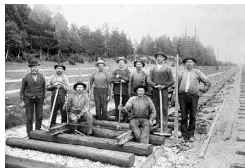
Rallare på Ostkustbanan, Cirka 1900.