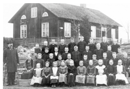
Bäckes gamla skola i Hedesunda nära Gävle, omkring 1900

I alla tider har föräldrar på olika sätt engagerat sig i sina barns utbildning. Med folkutbildningens framväxt på 1800-talet var föräldrars tillit till skolan inte alltid så hög, och många motsatte sig både undervisning och hur lärare fostrade barnen. Under det tidiga 1900-talet var så kallade skolstrejker ett spritt fenomen: föräldrar höll gemensamt sina barn hemma från skolan under längre perioder. Parallellt med dessa fenomen fanns också en framväxande organisering i föräldraföreningar där hem och skola samarbetade med varandra. I den här presentationen beskrivs föräldrars relation till skolan från folkskolan och framåt, med paralleller till dagens skola. Sara Backman Prytz , docent vid Uppsala universitet, berättar om sin forskning om föräldrars relation till skolan.