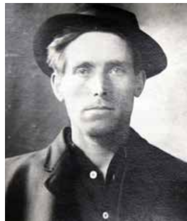
Joel Emmanuel Hägglund alias Joe Hill