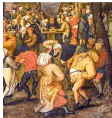
”Bondbröllop” av Pieter Bruegel den yngre.