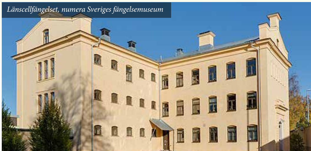
Länscellfängelset, numera Sveriges fängelsemuseum