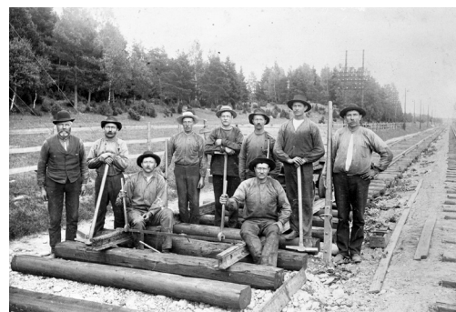
Rallare på Ostkustbanan, Cirka 1900.