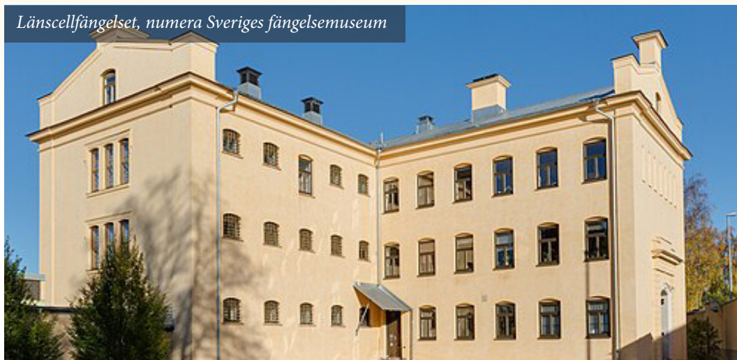
Länscellfängelset, numera Sveriges fängelsemuseum

I Gävle finns Sveriges fängelsemuseum, inrymt i det gamla Slottshäktet och Länscellfängelset, med uppgift att dokumentera svensk kriminalvård från 1500-tal till sent 1900-tal. Här speglas hela landets kriminalvårdshistoria, men museet hyser också ”Joe Hill Visitor Center”, tillägnat den berömda facklige aktivisten som dömdes och avrättades i USA. Vi får här en historisk bakgrund varefter museichef Desirée Kjellberg tar oss med på en vandring till platser i de närmaste omgivningarna med anknytning till Joe Hill. Promenaden avslutas vid Joe Hill-gården.