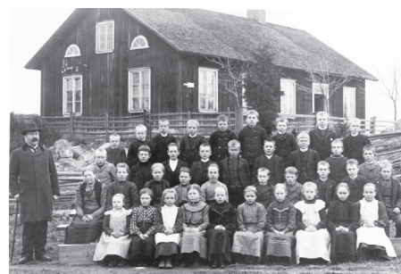
Bäckes gamla skola i Hedesunda nära Gävle, omkring 1900

I alla tider har föräldrar på olika sätt engagerat sig i sina barns utbildning. Med folkutbildningens framväxt på 1800-talet var föräldrars tillit till skolan inte alltid så hög, och många motsatte sig både undervisning och hur lärare fostrade barnen. Under det tidiga 1900-talet var så kallade skolstrejker ett spritt fenomen: föräldrar höll gemensamt sina barn hemma från skolan under längre perioder. Parallellt med dessa fenomen fanns också en framväxande organisering i föräldraföreningar där hem och skola samarbetade med varandra. I den här presentationen beskrivs föräldrars relation till skolan från folkskolan och framåt, med paralleller till dagens skola. Sara Backman Prytz , docent vid Uppsala universitet, berättar om sin forskning om föräldrars relation till skolan.