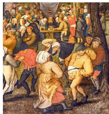
”Bondbröllop” av Pieter Bruegel den yngre.