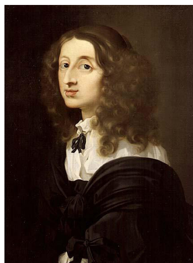
Drottning Kristina målad av Sébastien Bourdon.

Drottning Kristina (1626–1689) porträtteras redan i sin samtid som en lärd monark, en Nordens Minerva. Med hjälp av sina holländska bibliotekarier dammsuger hon den europeiska bokmarknaden och skapar på kort tid ett bibliotek på slottet Tre Kronor som snabbt blir ryktbart. Kan vi utifrån hennes boksamling säga något om hennes intellektuella intressen? Var hennes bibliotek ett utslag av kunskapsörst och kulturell aptit? Eller ska vi se biblioteket som ett politiskt verktyg – ett uttryck för den sortens iögonenfallande konsumtion som hon som barockfurste ägnar sig åt när hon ska etablera sitt land som en ny stormakt? Eva Nylander , docent i bok- och bibliotekshistoria vid Lunds universitet, resonerar kring dessa frågor och berättar om drottning Kristinas handskriftssamling på Vatikanbiblioteket i Rom.