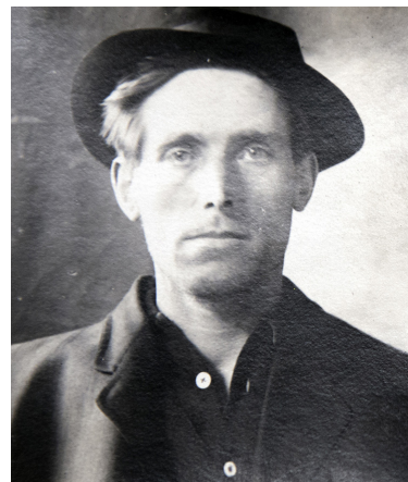
Joel Emmanuel Hägglund alias Joe Hill