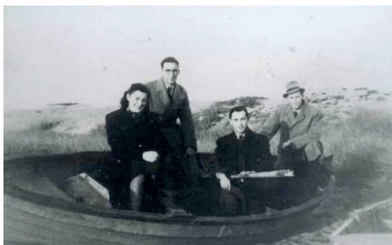
Flykten över Öresund, 1943