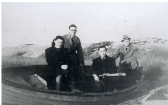
Flykten över Öresund, 1943