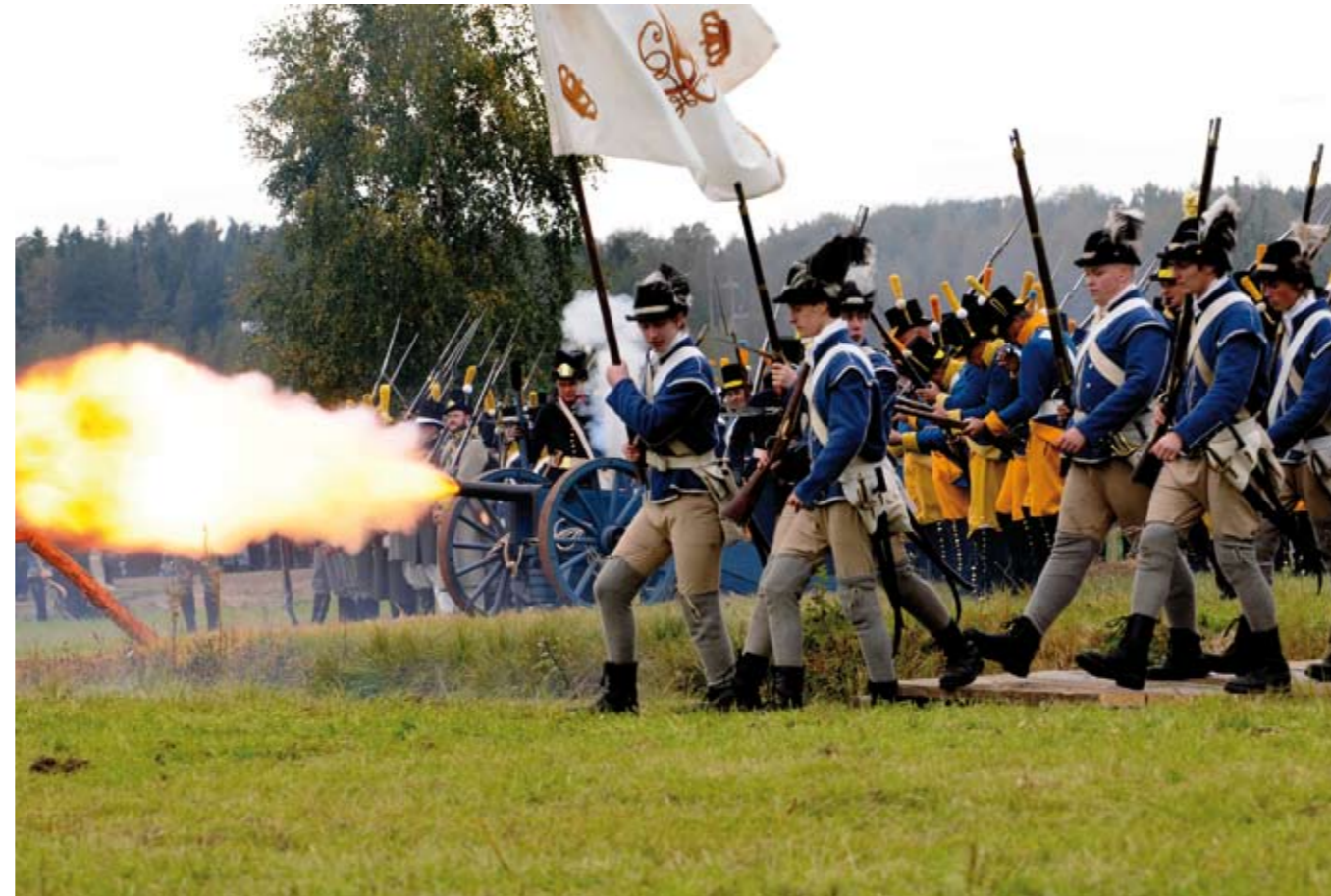
Slaget vid Oravais. Hösten 2008 samlades tusentals åskådare vid Oravais slagfält för att följa återskapandet av slaget 1808.