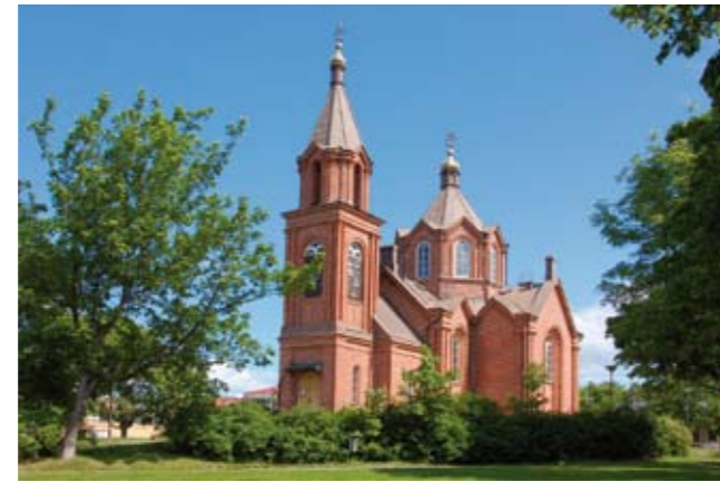
Helige Nikolaos kyrka ligger vid gamla Kaserntorget i södra delen av Kyrkoesplanaden. Kyrkan togs i bruk år 1866 och har sedan dess varit den ortodoxa församlingens huvudkyrka.