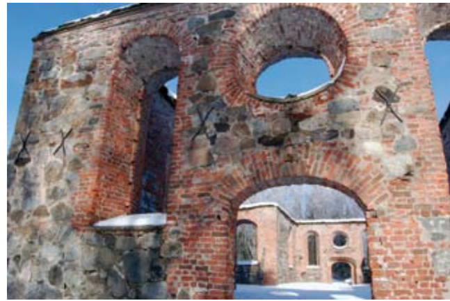
Ruinerna av Sankta Maria kyrka finns i Gamla Vasa. Kyrkan byggdes på 1300-talet.